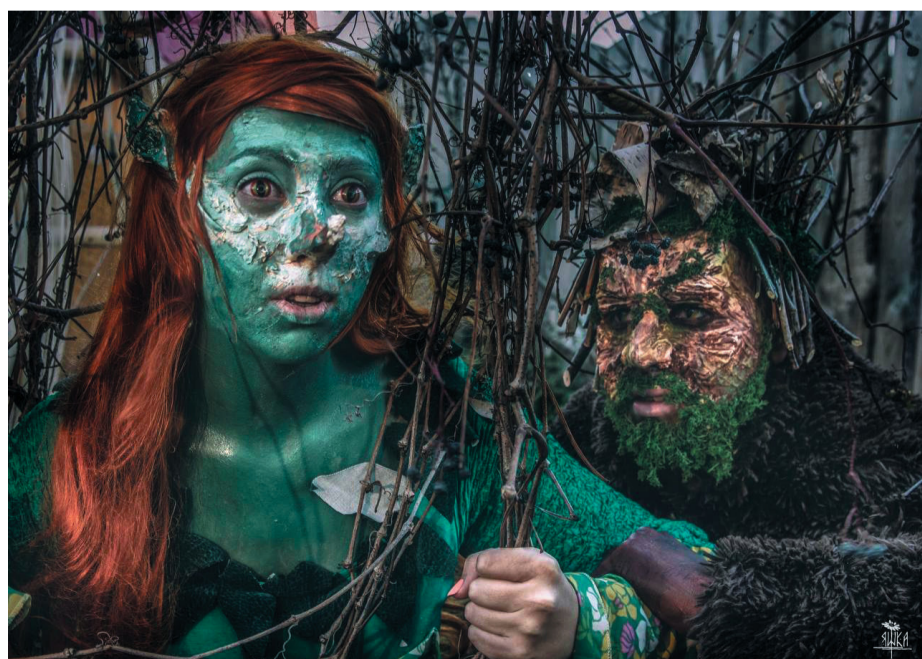
Главные герои – персонажи славянской мифологии