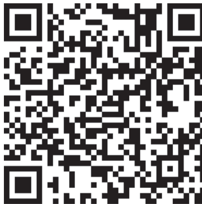
Проект «3/9 Царство» в Интернете