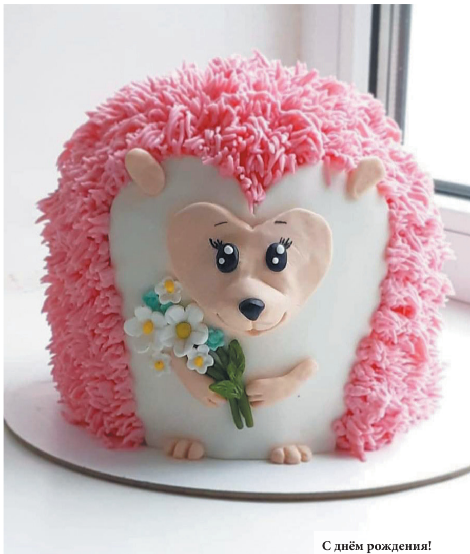
С днём рождения!

– Возможно, что-то связанное с хореографией. Или фотографией. В любом случае, она была бы творческой. Точно не работа в офисе.