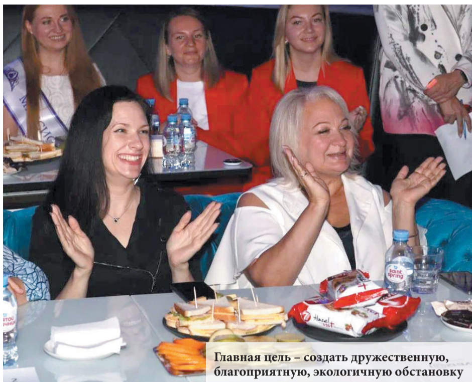
Главная цель – создать дружелюбную, благоприятную, экологичную обстановку