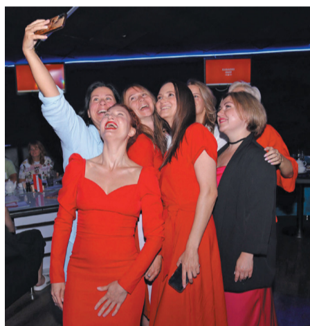
Селфи на память о первой игре

«Первая игра – пилотная, её не анонсировали. Готовились тщательно, и получили самые восторженные отзывы. Могу сказать с уверенностью – мы го-