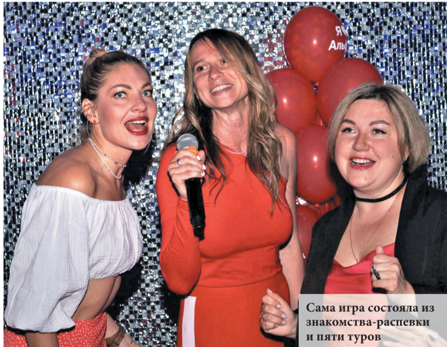
Сама игра состояла из знакомства-распевки и пяти туров

Сама игра состояла из знакомства-распевки и пяти туров. Звучали вопросы на музыкальную логику, аудиовопросы, караоке-загадки. А в финале был блиц, во время которого нужно было угадать исполнителей по изображениям.