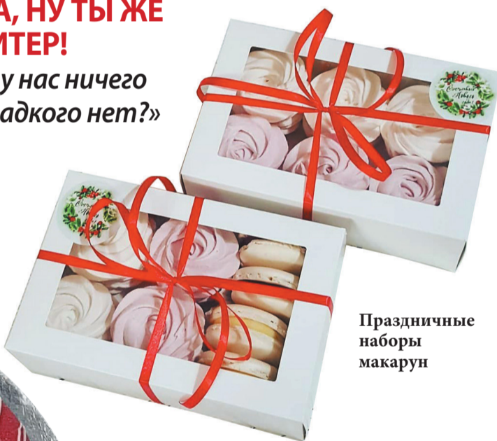
Праздничные наборы макарун