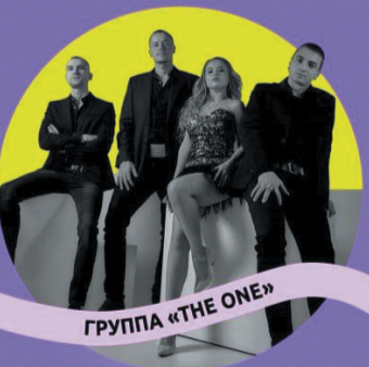
ГРУППА «THE ONE»