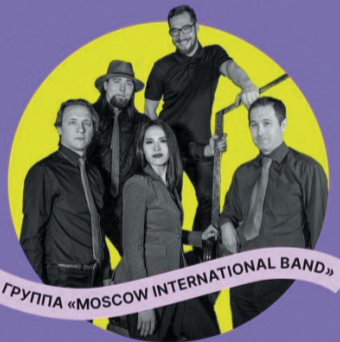
ГРУППА «MOSCOW INTERNATIONAL BAND»